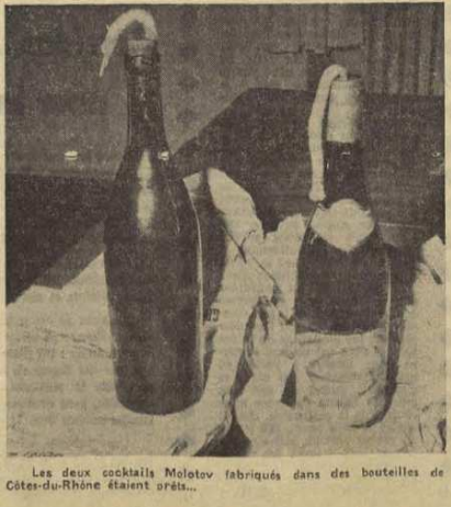
Les deux cocktails Molotov fabriqués dans des bouteilles de Côtes-du-Rhône étaient prêts...

Peu après, dès 6 heures du matin le même jour, les auteurs sont retrouvés et inculpés. Ils auraient revendiqué leurs attentats dans un tract : « en souvenir des victimes de la répression de mai ». Ils sont quatorze en tout et appartiendraient à un « Comité révolutionnaire du Front populaire » dont personne n'avait jamais entendu parler et dont ce serait la première action.