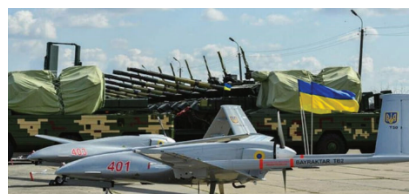
Drone militaire turco-ukrainien Bayraktar TB-2