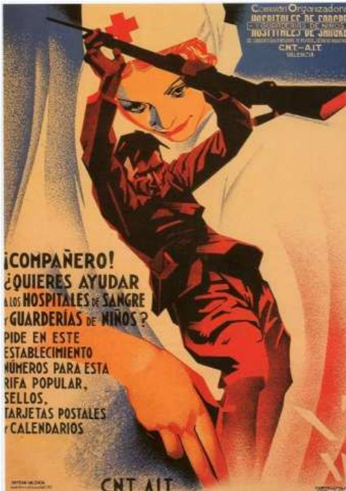
Affiche, 1937, des « affichistes de la CNT AIT, » mais on reconnaît aisément le style et le trait d'A. Ballester, pour la Commission des hôpitaux de campagne CNT AIT de Valence.

Nous sommes au début de la Révolution. Le rôle de l'affiche est de capter l'attention des passants dans la rue, afin de réaliser des collectes de dons plus élevés : l'infirmière est un ange, une véritable figure de star « hollywoodienne » et le soldat est fier et vaillant, faisant face à l'ennemi mais dans une position d'attente, sans danger perceptible. Infirmière et soldat regardent ensemble dans la même direction, vers le futur.