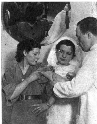
Campagne de vaccination contre le typhus, Mundo Graphico, 12 mai 1937

L'iconographie avait donc aussi pour rôle de redonner de la respectabilité aux infirmières vis à vis de la société espagnole qui – bien que républicaine ou révolutionnaire, restait encore largement imprégnée de stéréotypes issus de l'Eglise. Par ailleurs, dans le cadre de la politique d'émancipation féminine, les représentations des infirmières ont pour objet de donner à voir des femmes heureuses dans un travail qui est socialement accepté.