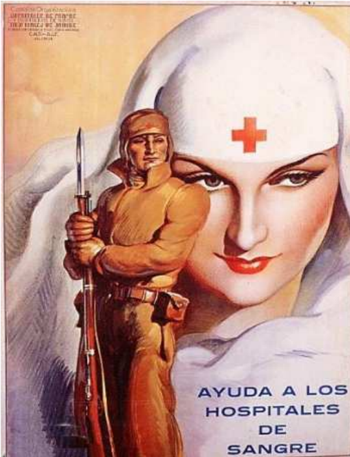
Affiche de 1936, du Comité d'organisation des hôpitaux de campagne CNT-AIT de Valence.

Nous sommes au début de la Révolution. Le rôle de l'affiche est de capter l'attention des passants dans la rue, afin de réaliser des collectes de dons plus élevés : l'infirmière est un ange, une véritable figure de star « hollywoodienne » et le soldat est fier et vaillant, faisant face à l'ennemi mais dans une position d'attente, sans danger perceptible. Infirmière et soldat regardent ensemble dans la même direction, vers le futur.