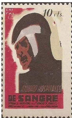
Illustration de Badia Vilato (texte en espagnol), affiche et timbre

Dans l’affiche réalisée par Badia Vilato toujours pour la campagne de la CNT-FAI de Barcelone de 1937, l’infirmière disparaît totalement de l’affiche, pour ne laisser place qu’au blessé. Le ressort de la mobilisation en faveur de la solidarité a évolué depuis le début de la Révolution, un certain optimisme et une confiance dans l’avenir laissant la place à la douleur et de sombres perspectives. La Révolution avait laissé définitivement la place à la guerre, et fatalement elle ne pouvait être que perdue du fait du déséquilibre des forces que ne compensait plus l’enthousiasme et l’énergie insufflée par l’espoir d’une transformation sociale radicale.