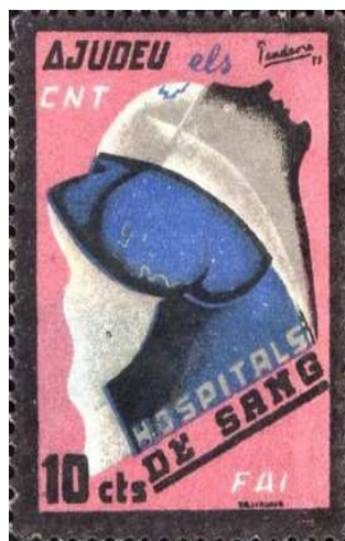
Illustration de Cadena (texte en catalan), affiche et timbre