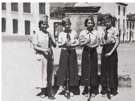
Miliciennes d'une unité sanitaire

Sur les photos comme sur les affiches, les infirmières sont toujours vêtues de l'uniforme réglementaire, une blouse blanche immaculé avec une coiffe qui retient leurs cheveux, uniforme qui identifie la profession.